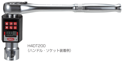
H4DT200 (ハンドル・ソケット装着例)