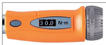
デジタル表示部分

トルク設定は、直接数値を読み取ることができるメカニカル機構のデジタル表示値により行います。従来のような主目盛・副目盛を読み取る必要がないため、設定ミス防止や締付けトルク確認・管理に便利です。エアコンなどの配管用、自動車・二輪関係のトルク規制箇所、CATV・光ファイバーケーブルのコネクター・交換器取付けなどの通信設備用、消防設備避難具のアンカーボルトなど、あらゆる作業分野で活躍します。ミリ・インチサイズおよび四角・異形ボルト・ナットに関係なく、必要なサイズに調整できるすぐれもの！ワイドタイプは六角二面幅が大きく、非鉄・樹脂ナット等の低トルク締付けに最適 (TMWM25W、TMWM50W、TMWM100W、TMWM150W)。