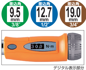
デジタル表示部分

トルク設定は、直接数値を読み取ることができるメカニカル機構のデジタル表示値により行います。従来のような主目盛・副目盛を読み取る必要がないため、設定ミス防止や締付けトルクの確認・管理に便利です。あらかじめ設定したトルク値に達しますと「カチッ」という音、または手に軽い「ショック」でお知らせします。ソケットの着脱が容易で、作業時には外れにくいソケットホールド機構付。ワンプッシュ操作でソケット交換ができます。