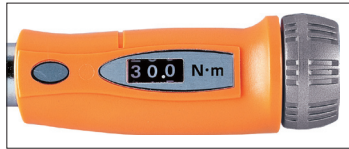
デジタル表示部分