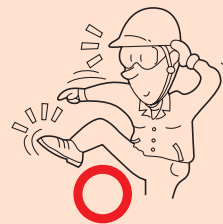
図 3 fig.3

Do not disassemble or modify wrenches except expendables. Disassemble or modification made by unauthorized personnel may result in malfunction or personal injury. (fig.2)