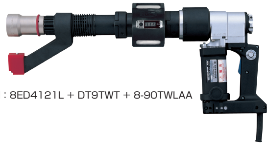
取付例：8ED4121L + DT9TWT + 8-90TWLAA