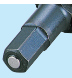
先端マグネット部