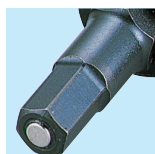
先端マグネット部