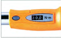
デジタル表示部分

あらかじめ設定したトルク値に達しますと「カチッ」という音、または手に軽い「ショック」でお知らせします。