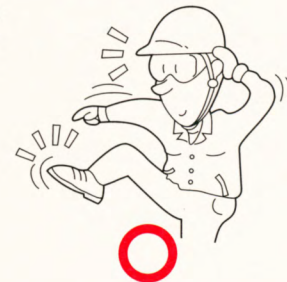
図 3 fig.3

Do not disassemble or modify wrenches except expendables. Disassemble or modification made by unauthorized personnel may result in malfunction or personal injury. (fig.2)