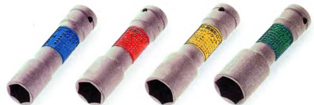
4A-17LN 4A-19LN 4A-21LN 4A-22LN