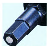
マグネット先端部

※その他特殊形状仕様のヘキサゴンソケットの制作も承っております。お見積りの際には P258 の「特注見積シート」をご活用ください。