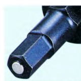
マグネット先端部