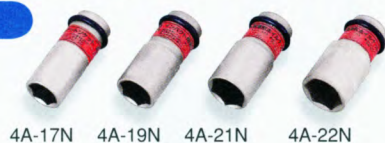
4A-17N 4A-19N 4A-21N 4A-22N