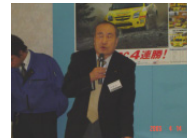
釧路家具建具生産(協)