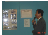
株式会社山仁野口商会