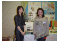
株式会社インテリアコーディネーター