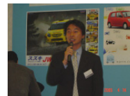
株式会社スギヤマオート