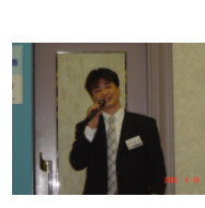
(有)サンクリーニング