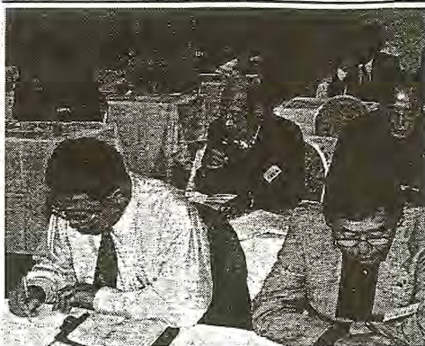
釧路市動物園の活性化策を提案した例会

ホッキョクグマを間近 移していることから、釧路市動物園の活性化を導いた旭川市旭山動物園の入り場者数が好調に推