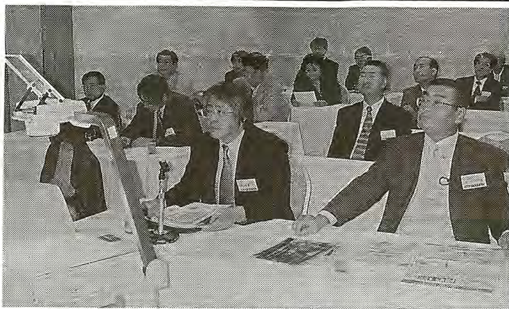
釧根への高速道路整備の必要性を訴えたあすなるクラブの例会