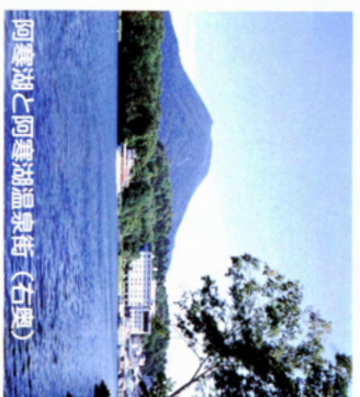
阿寒湖と阿寒湖温泉街（右奥）