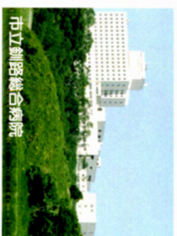
市立釧路総合病院

釧路市には、救命救急センター機能を備える市立釧路総合病院をはじめ、日赤病院、労災病院など3つの総合病院があり、年間延べ100万人の通院があります。この他にも数多くの医療機関があり、安心して移住、長期滞在が可能です。