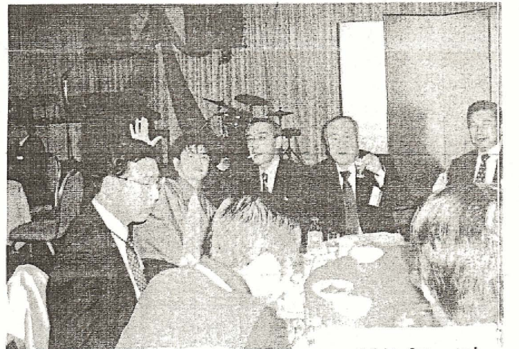
のってるかい?いえーい!