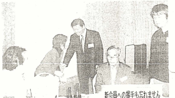
新会員への握手も忘れません