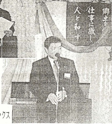
伊東市長も何時になくリラックス