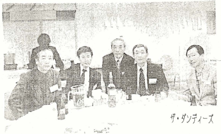
ザ・ダンディーズ